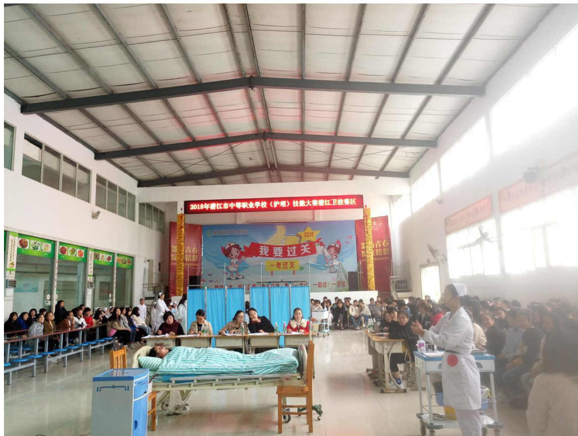
图 18 2018 年市级技能大赛现场静脉输液赛项

(1) 以赛促学。人人参与的班级、校级比赛，给同学们提供了观摩和展示的平台，每名同学都得到了充分的锻炼，并从参赛中认识到了自己的不足和优势；通过赛前培训，使学生了解了岗位的工作过程，学习积极性得到充分调动，加强了专业理论知识与操作技能的联系，提高了专业能力和综合职业素质。在备赛过程中，有的同学自发地长期坚持早晚自习和双休日训练操作技能，磨砺了他们的意志，培养了他们不怕苦、不怕累、锲而不舍的精神。