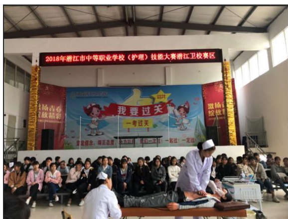
图16 市级护理技能大赛现场

2018年我们组织全校学生参加了校级护理技能大赛和康复技术大赛（图16），选拔和训练学生参加了市级护理技能大赛和康复技术大赛（我校共有30名学生荣获市级一、二、三等奖），以赛促学，学生的专业技能得到有效提升。我校积极开展护士资格考试考前辅导（图17），2018年324人参加全国护士执业资格考试，合格率为81%，远高于今年52%的全国平均合格率。从回访情况看，医院和医药企业等单位对我校技能人才培养的满意度为95%。