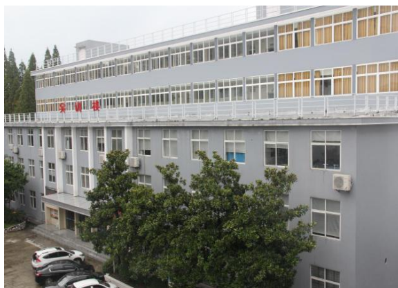
图 2 实训楼