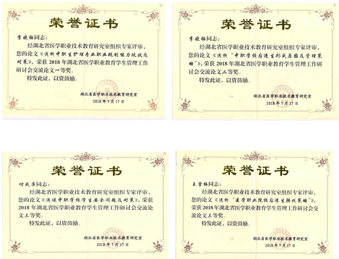
图 13 班主任参加学生管理论文征文比赛获奖

六是开展丰富多彩的校园德育活动。我校推行“周晨会”“周小主题、月大主题班会活动”制度，组织学生“学雷锋走进优抚养老中心看望老人，开展“春季传染病防治”主题班会，组织我校数百名学生参加“潜江市国际马拉松”医疗志愿者；举行 2018 年应届毕业生春季招聘会；举行秋、春季运动会；参加“全卫生系统 5.12 护士节曹禺大剧院文艺汇演”，开展暑期防溺水、防中暑、法制教育、消防安全演练（图 14）、灭火器使用以及火灾逃生现场演练等安全专题教育活动，开展纪律整顿大会；开展朗诵经典、道德讲堂、感恩教育、专题德育活动，进行手机管理专项整治活动，乘着“没有差生，只有差异”的理念开展后进生