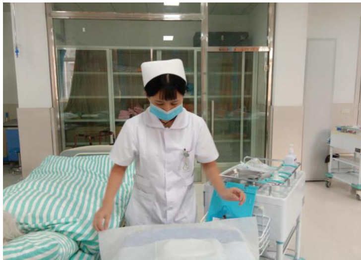
图 4 操作考核