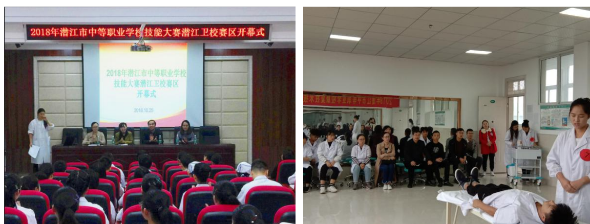
图6 2018年市级技能大赛

每门专业技能课的教学安排上，学校开足实验实训学时，在平时的实践课上就对专业技能进行比赛和考核；在毕业实习前再安排专业综合实训和考核，严把“实践操作不合格不下实习点”的实习关；每年组织学生参加覆盖所有专业的全校和全市技能大赛。一系列技能比赛活动，激发了学生的学习兴趣，鼓舞了学生学习专业技能的勇气，坚定了学生热爱专业、献身专业的信念。2018年我校组织了人人参与的校级技能大赛，承办了市级护理技能大赛和康复技能大赛(图6)。