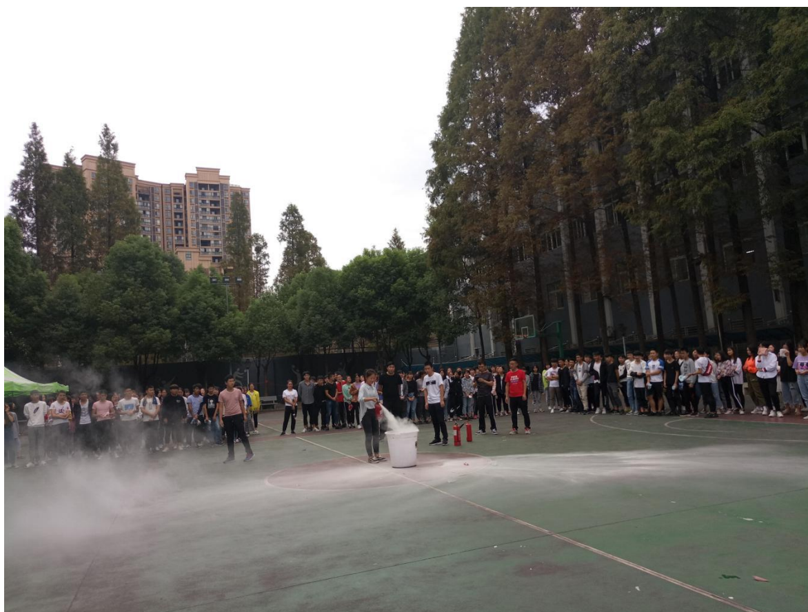
图 14 消防演练

转化“阳光班”开展后进生专项整治活动，利用世界艾滋病日，开展“2018年青年学生防艾活动”，利用法制宣传日，组织全校各班观看“我与宪法”微视频主题活动，开展“文明风采”、筹办元旦晚会，等通过丰富的课外活动达到寓教于乐的目的以全面提升学生素养。