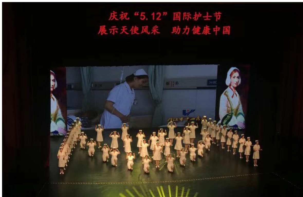
图 15 参加 2018 年潜江市卫计系统“5·12”国际护士节汇演

季学期学生运动会” “2018年秋季学期学生运动会” “2019年元旦文艺晚会”。