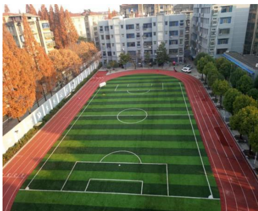
图 1 田径运动场

学校现有 2774 m 2 人工草坪塑胶跑道的运动场（图 1）1 个，篮球场 2 片，羽毛球场 2 片，教学楼、实训楼（图 2）和行政楼各 1 栋，学生公寓 3 栋。2018 年度学校继续加强教学硬件建设，新增实训设备 67.8 万元，教学设备固定资产达到 1037.5 万元（见表 1），教学、实训条件进一步改善。