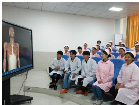
图 8 示教室和三维解剖教学系统