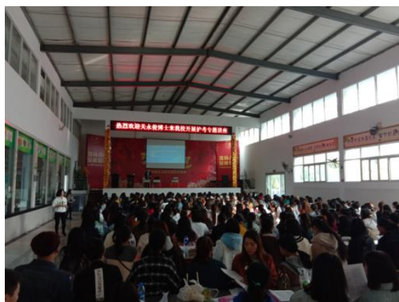
图17 护考誓师动员大会