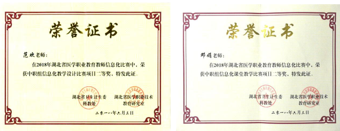
图 5 信息化教学设计二等奖

荣获信息化课堂教学赛项二等奖，范欢荣获信息化教学设计赛项二等奖（图 5），我校荣获中职组团体二等奖。