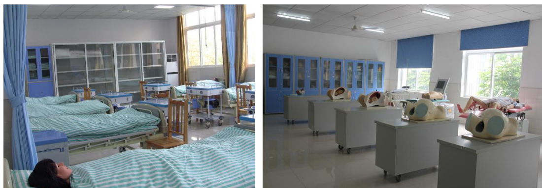
图 9 模拟病房和妇产科实训室

士站、外科和急救、模拟手术室、妇产科、儿科、五官科、老年和社区、模拟 ICU、临终关怀、无菌技术、医护礼仪等医护技能实训室 22 间（图 9），基础化学、药物合成、制水、液体制剂、