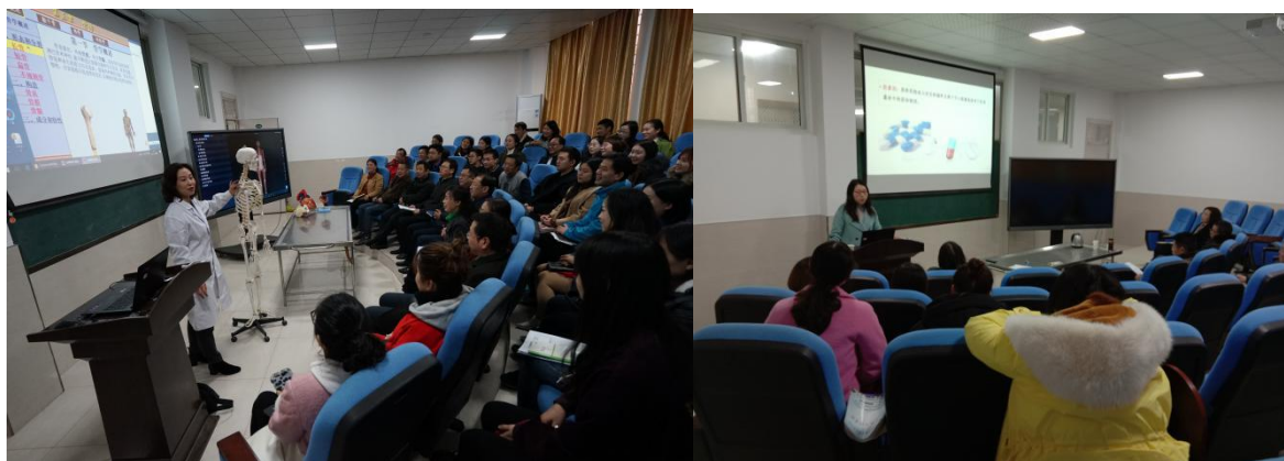
图12 教师集中业务学习

2018年，我校组织教师集中业务学习30次（图12）、集体备课12次、讲公开课44次、试讲33人次、听课988人次，组织教师参加以信息化教学为主的校内培训52学时；选派9名教