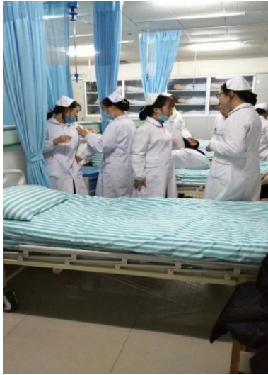
图 3 分组练习