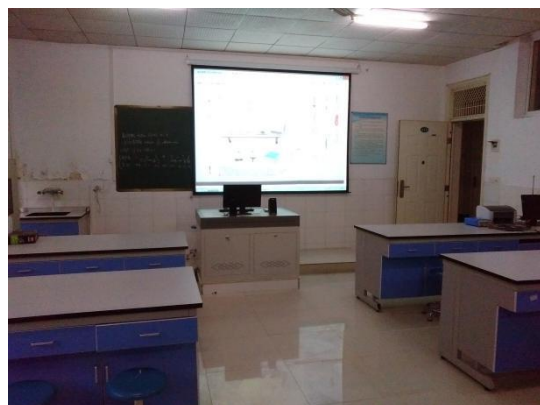
图 7 生理药理实训室和虚拟实验系统

我校校内实训基地建筑面积约 4100 平方米，共有实训室 49 间，包括形态学、生理学、药理学等基础医学实训室 8 间（图 7、图 8），心肺听诊、腹部触诊、无菌技术、模拟病房、护