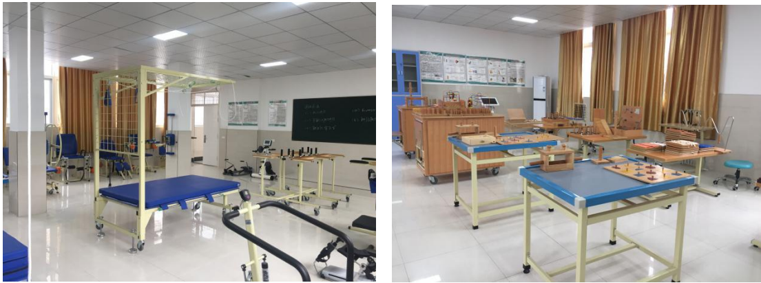
图 11 运动疗法实训室和作业疗法实训平台

我校建有校外实训基地 35 个，包括潜江市中心医院、潜江市妇幼保健院、潜江市二医院、潜江市中医院、潜江康复医院、江汉油田总医院、江汉油田总医院五七院区、沙洋县人民医院、宜昌市三医院、武汉市三医院、新会人民医院、横店文荣医院、金坛区人民医院等医院，市内各乡镇卫生院和社区卫生服务中心，潜江制药股份有限公司、湖北健奇药业股份有限公司、华世通潜龙药业有限公司、潜江市益民药业、湖北鸥越药业等医药企业及潜江市静文爱眼有限公司，完全能满足我校现有专业和学生实训的教学需要。